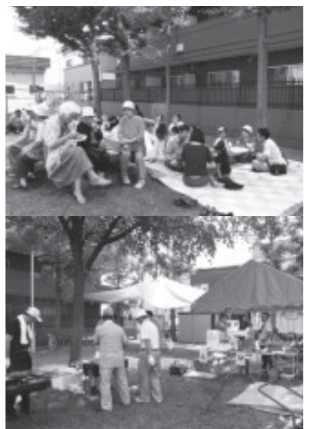
焼肉パーティー（平成26年8月）