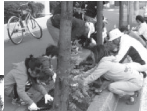
ます花壇の花苗植え（平成26年5月）