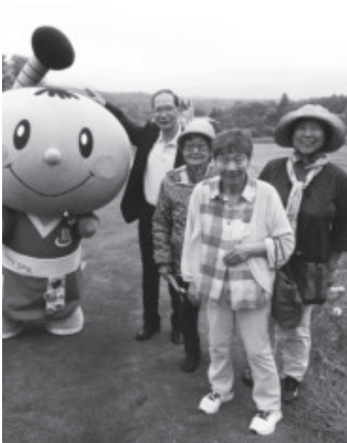
日帰り研修--ユニニの湯（令和元年9月）