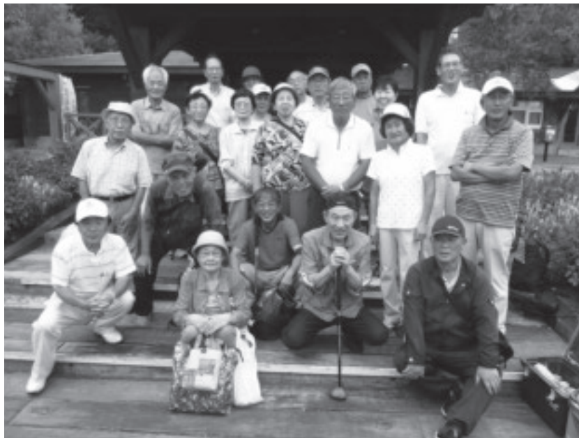
日帰り研修--ユニニの湯（平成28年9月）