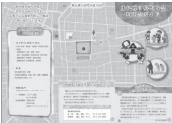
東札幌中央町内会ガイド（平成31年3月）