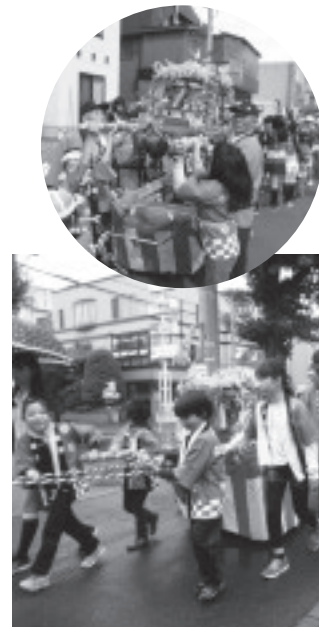
子どもみこし（平成28年6月）